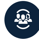
Colaboraciones y alianzas