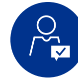
Escucha y acción