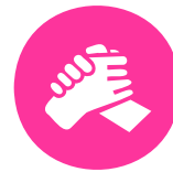
Apoyo a los países en desarrollo