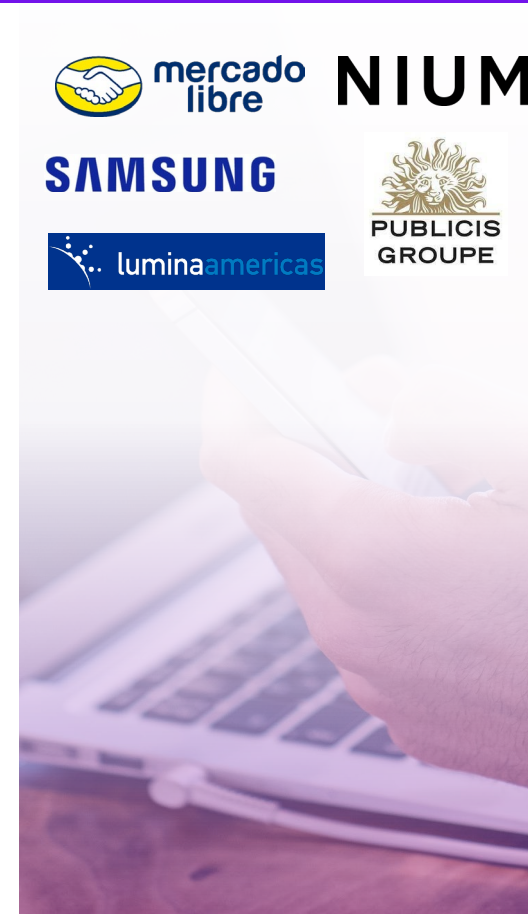
TECHNOLOGY, MEDIA & TELECOM