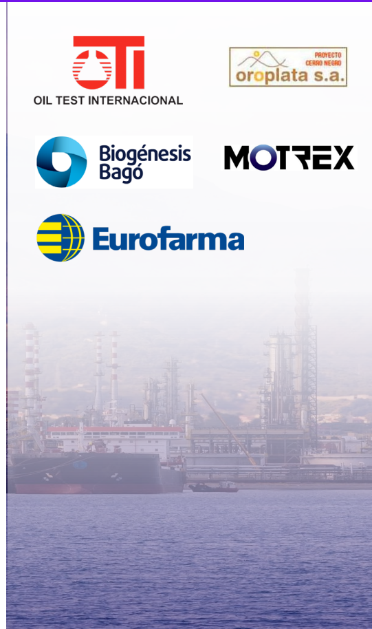
INDUSTRIAL & MANUFACTURING