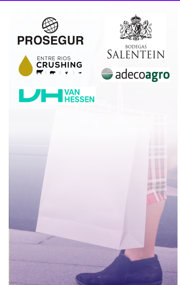
CONSUMER & RETAIL