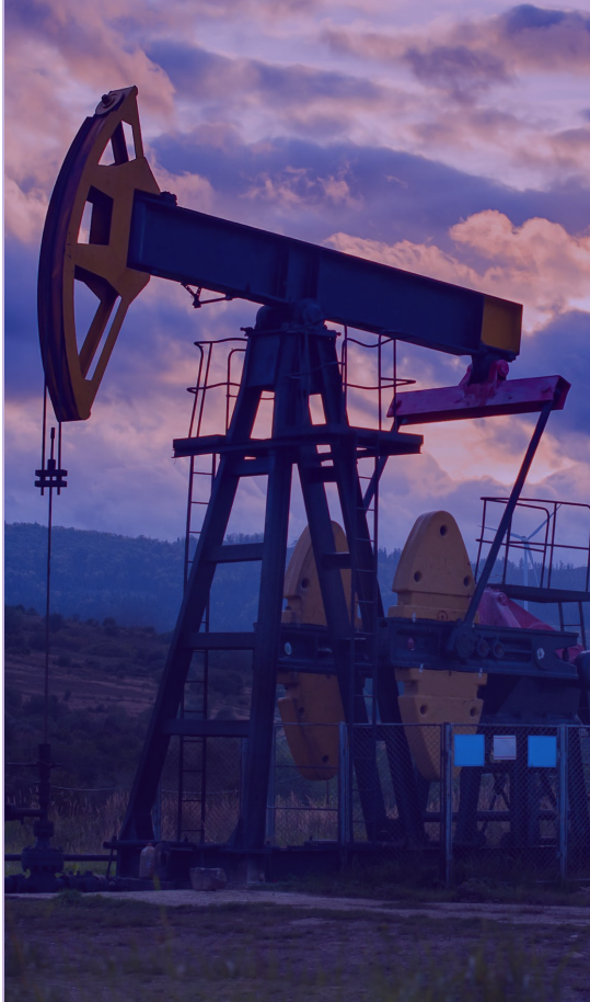
ENERGY, OIL & GAS