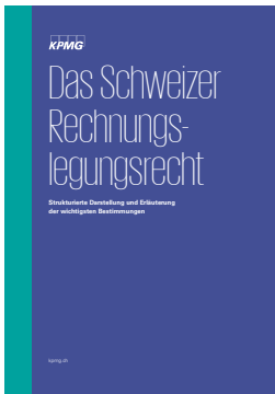
Das Schweizer Rechnungslegungsrecht Strukturierte Darstellung und Erläuterung der wichtigsten Bestimmungen