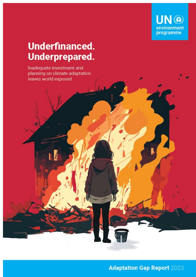
Informe del PNUMA presentado durante la COP28