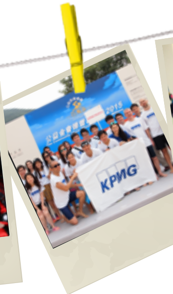
公益金会德丰百万泳

毕马威中国派员工参加国际明德医院举办的一年一度抬轿大赛,为抬轿比赛慈善基金筹款,以支持当地约130家慈善机构。我们的员工每年会悉心设计队服和轿子。