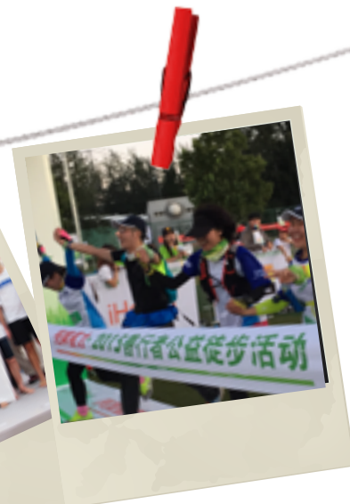
中国扶贫基金会“善行者”

每年,毕马威员工参加在浅水湾泳滩举行的400米赛程。所有的活动捐款均通过香港公益金用于支持155家会员社会福利机构。