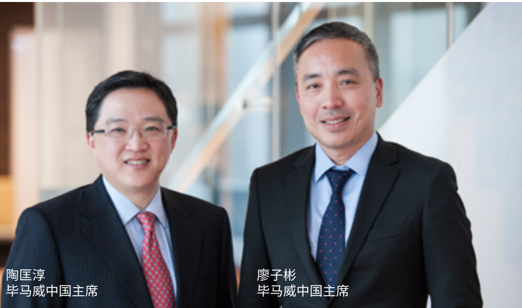
陶匡淳 毕马威中国主席

这个结构有序的赠与平台不仅可以帮助实现毕马威的企业社会责任目标;而且从长远角度而言,也能够确保所有的公益项目都是能满足社会需求、伸缩有度及可持续发展的。