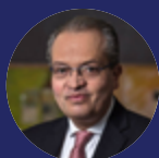
Fernando Carrillo Procurador General de la Nación