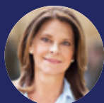
Marta Lucía Ramírez Vicepresidenta de la República