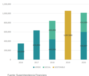
VALOR DE EMISIONES DE BONOS TEMÁTICOS (COP)