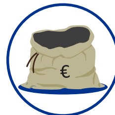
Streichung von Mitteln für laufende Projekte