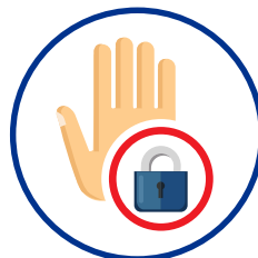
Verzögerte oder gestrichene Projektstarts