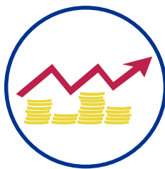
Verschlechterte Konditionen für Finanzierungen