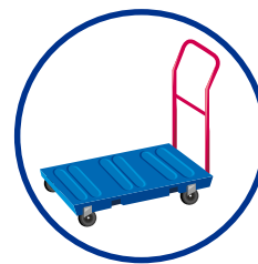
Geringere Produktion durch kleine und mittlere Gewerbe- und Industriebetriebe