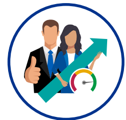
Sicherstellung der Leistungsfähigkeit von Anbietern