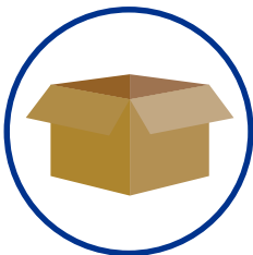
Mangel an dringend benötigten Beschaffungsgegenständen