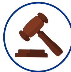
Krisenbedingte Runderlasse und Sonderregelungen