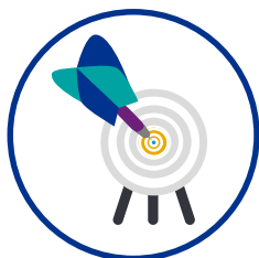
Schnelle und flexible Reaktionsfähigkeit