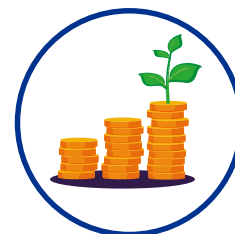
Langfristig ausreichende Kapitalausstattung