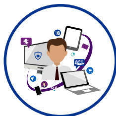
Fehlender resiliente Strukturen und belastbare IT-Ausstattung