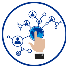
Aufrechterhaltung der (Vereins-) Infrastruktur