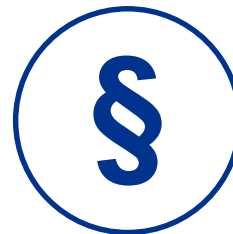
Einhaltung steuerlicher Vorgaben insbesondere im Hinblick auf die zur Covid-19-Pandemie erlassenen BMF-Schreiben