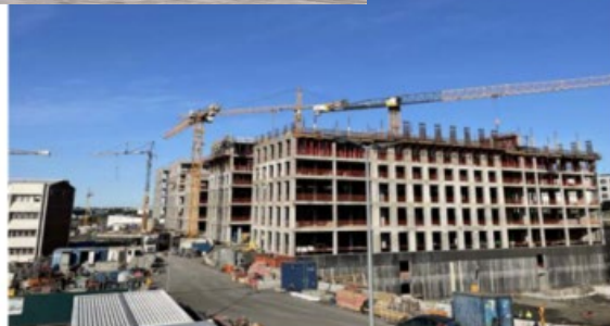
Ljósmyndir: Ný Landspítalinn

Þringbraut Mikió hefur áunnist á einu ári í uppsteypu á meðferðarkjarninum í Nýja Landspítalanum. Fyrri myndin var tekin í september 2022 og hin síðari ári síðar eða fyrr í þessum mánuði.