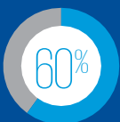
自動化と テクノロジーの活用