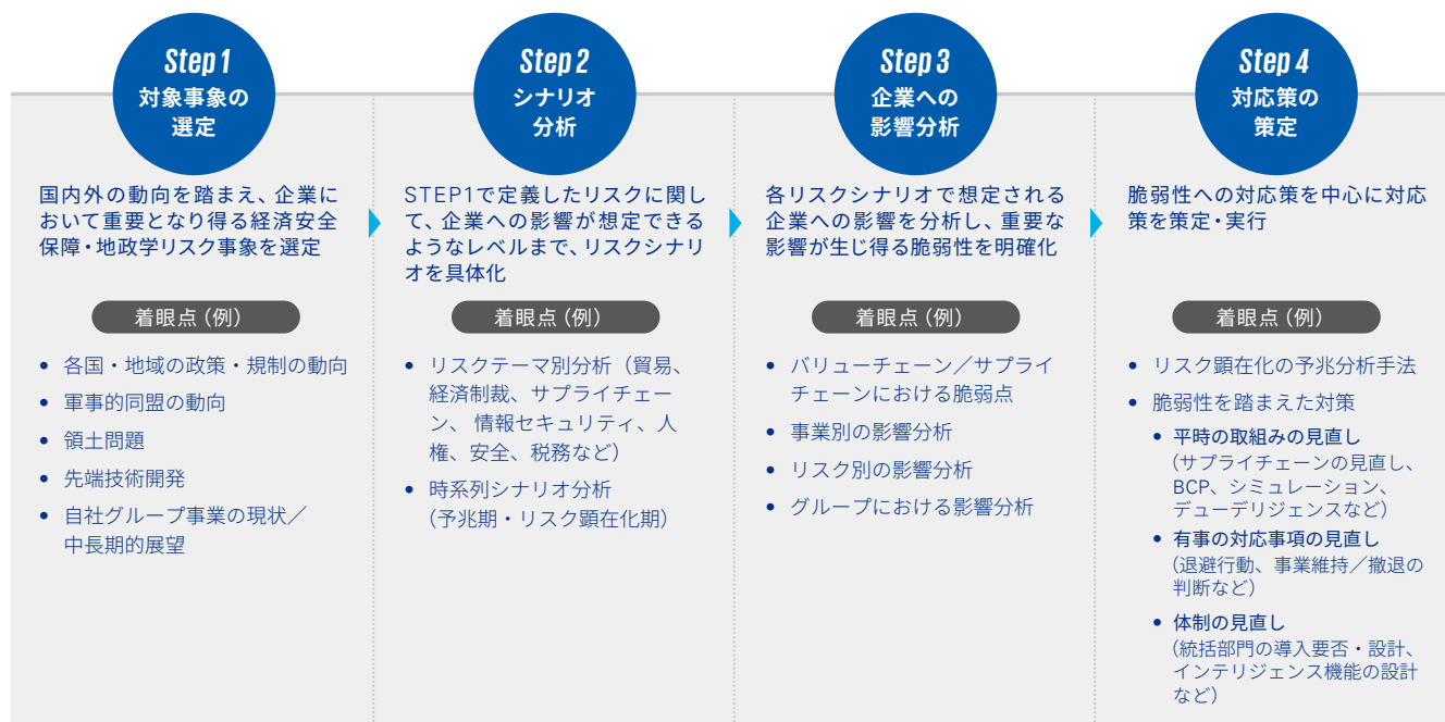
図表3 シナリオ分析のステップ例

まず、サプライチェーン戦略、BCP（事業継続計画）の見直しが重要です。有事では、製品・原材料の輸送手段・ルート制限、各国制裁による取引制限、生産工場でのオペレーションの停止、原材料の高騰などにより、サプライチェーンに多大な支障をきたす恐れがあります。そのため、リスクの高い国・地域との取引に依存する原材料・部品を中心にサプライチェーンの多元