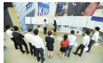
Advisory 1,2 교육

Technical School 1, 2' 를 통해서 세무 전문 지식과 Self-Leadership을 향상 시키는 기회도 제공합니다.