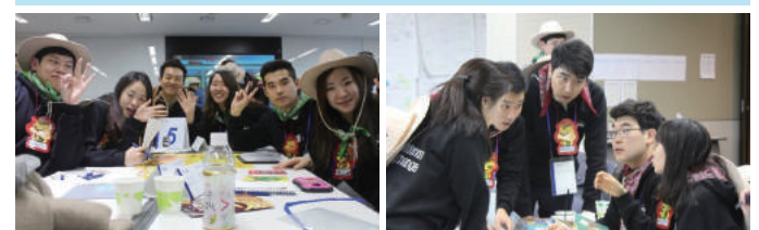
Advisory Fundamentals 교육