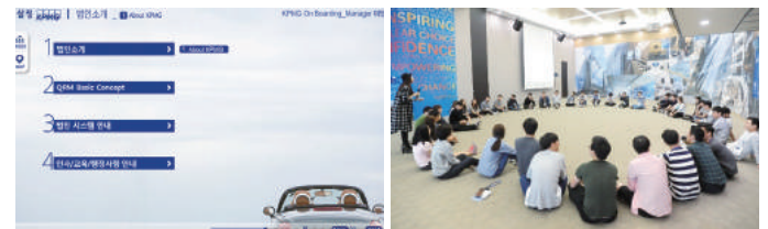
KPMG On Boarding 프로그램

중심의 교육 과정을 제공합니다. 특히, ‘신입 공인회계사 입문 교육’과 ‘Advisory Fundamentals 교육’은 다양한 활동을 통해서 KPMG Story를 체화하도록 하여 법인에 대한 자부심과 로열티가 충만하고 법인 생활에 필요한 태도와 가치관이 확립된 인재를 육성합니다.