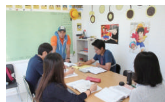
고성과자 해외 연수 프로그램

Higher Purpose를 주도할 수 있는 글로벌 인재로 성장할 수 있도록 ' 고성과자 해외 연수 ', ' S.Manager 승진자 해외 연수 프로그램 '을 지원합니다. Junior 1~2년 차에게는 ' EF 온라인 어학 스쿨 ' 과정을 전액 지원하여 학습의 기회를 제공하고, 우수 학습자에게는 '영국 케임브리지 해외 연수' 의 기회가 주어집니다. 다양한 해외 연수 프로그램은