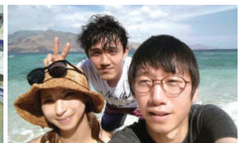
GEP 성적 우수자 해외 연수