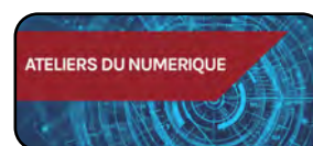
Les Ateliers du Numérique

Le Fonds Bleu permet de soutenir financièrement les entreprises actrices de cette transition numérique .