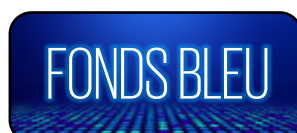
Le Fonds Bleu