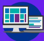
KPMG Clara Analytics