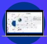
KPMG Clara Client Collaboration

KPMG cuenta con un equipo dedicado a la creación, desarrollo e implementación de nuevas tecnologías, lo que hará que el proceso de auditoría sea más ágil, innovador y eficiente.