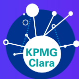
KPMG Clara Workflow