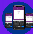
App de Inventario físico