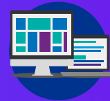
KPMG Clara Analytics