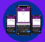
App de Inventario físico