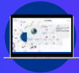
KPMG Clara Client Collaboration

KPMG cuenta con un equipo dedicado a la creación, desarrollo e implementación de nuevas tecnologías, lo que hará que el proceso de auditoría sea más ágil, innovador y eficiente.