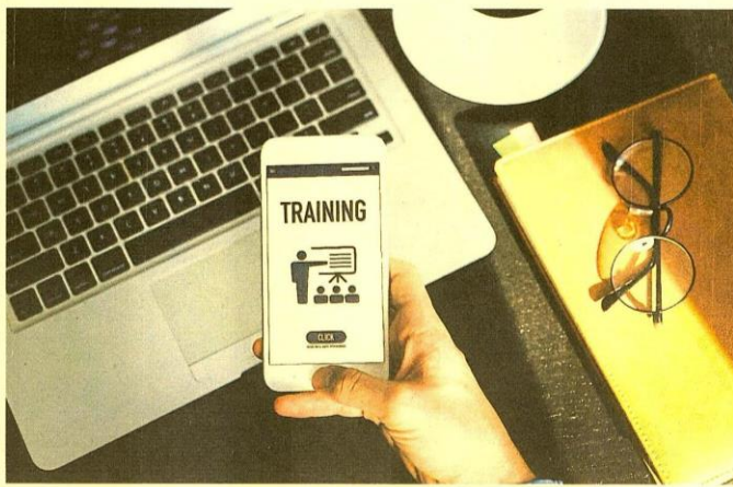
El 'blended learning' es el modelo que más emplean las escuelas de negocios para el desarrollo de su oferta 'online'.

"Las maestrías en línea permiten al estudiante compaginarlas con su actividad profesional, porque derriban las barreras de tiempo y espacio. Además, acercan los nuevos métodos de aprendizaje a la formación tradicional, com-