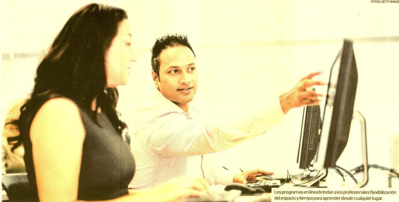
Los programas en línea brindan a los profesionales flexibilidad del espacio y tiempo para aprender desde cualquier lugar.