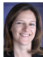
Céu Carvalho Incentives Tax