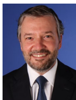
Miguel Baptista Financial Services Tax