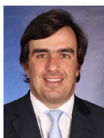
Filipe Grenho Financial Services Tax