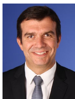
Pedro Alves Corporate Tax