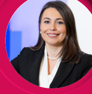
Şirin Soyal Atma Bağışla Kampanyası