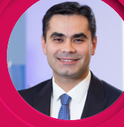
Hakan Orhan Mutluluğa Çevir