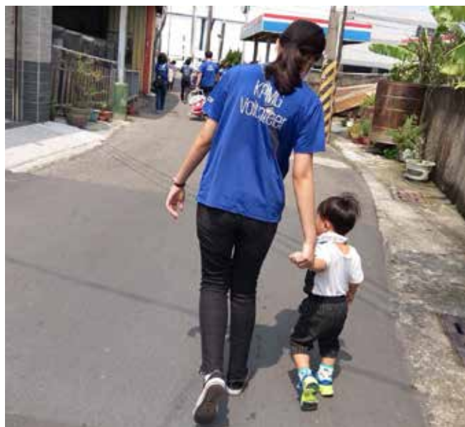
KPMG志工隊與小天使家園開心出遊