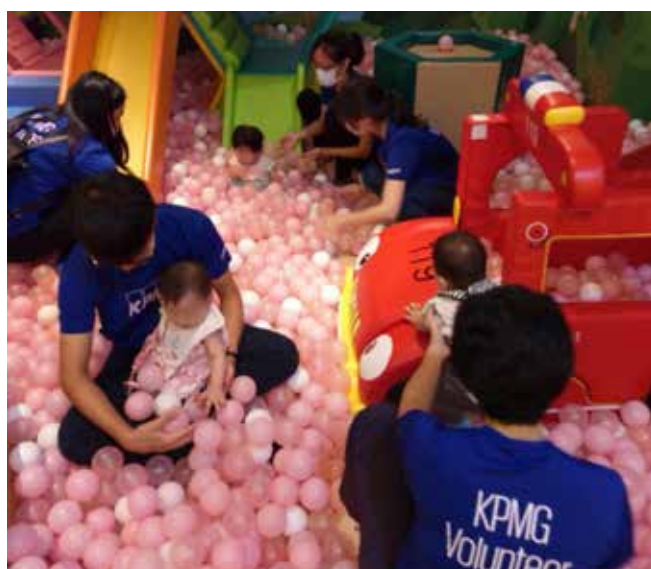
志工陪伴孩子在遊戲區玩得不亦樂乎