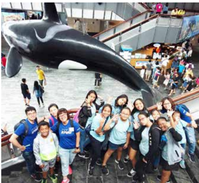
孩子們和志工在海生館遊玩的開心笑容

為了將人文陪伴的精神傳遞到台灣的偏鄉角落，KPMG 志工隊連續六年舉辦國內志工營活動。繼去年到台東出隊之後，今年前往屏東地區，陪伴屏東教養院、希望合唱團以及善導書院的大、小朋友們。