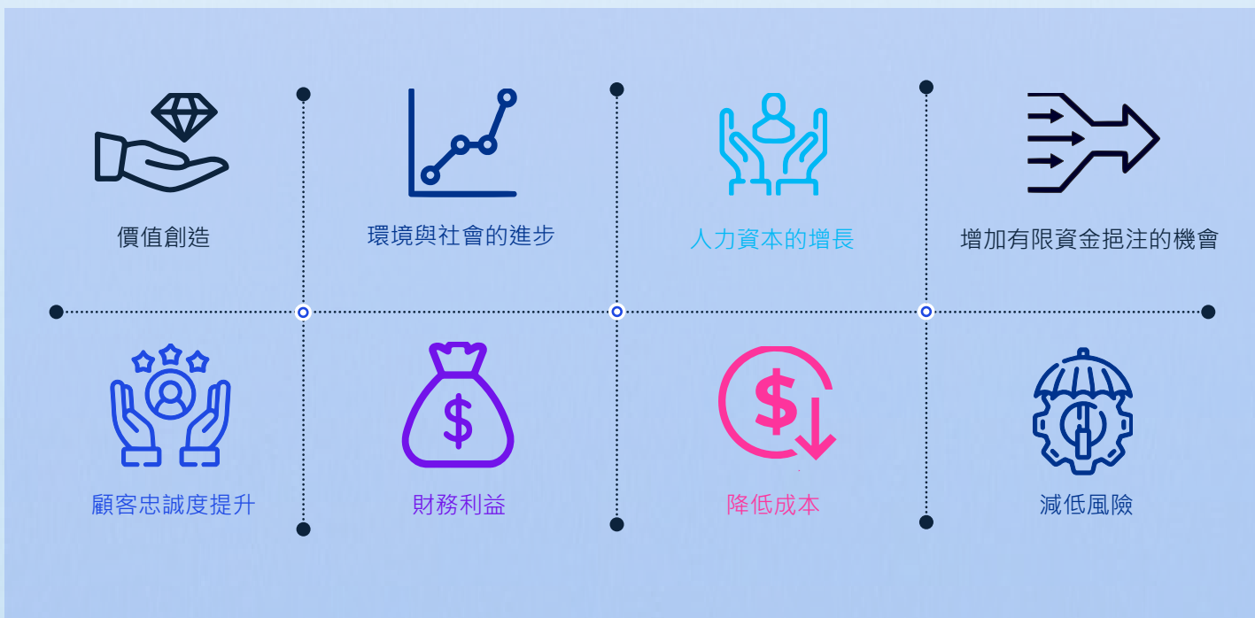
圖三、成為永續實踐家的好處是顯而易見的

從家族企業的角度來看，成為永續實踐家的好處是顯而易見的，除了可透過減少浪費、提升資源再利用率來降低營運成本外，許多家族企業亦將其視為創造價值與競爭優勢的機會；再者，因客戶普遍希望能與對社會及環境做出承諾並展現影響力的企業合作，因此家族企業在展現永續行動力之際，不但可以提高顧客的忠誠度、增加收益，同時也攬取了投資者的目光，增加未來獲得資金挹注的機率。基於長期營運的使命，讓家族企業深信他們有責任及義務為更美好的世界盡一份心力，優秀的人才也會願意投身於對永續行動有堅定承諾的企業，進而增長人力資本。而由於對環境與社會的持續投注心力，無形中亦降低了家族企業的營運風險。