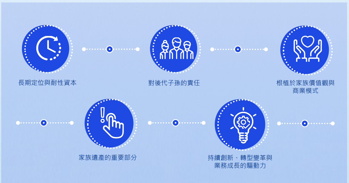
圖二、家族企業推展永續行動具有先發優勢

《調查》指出，家族企業在推展永續行動上具有多項先發優勢。家族企業的長期定位以及對耐性資本的投資，可以被視為是希望為後代子孫創造並保留一個健康環境與企業的責任感，基於這樣的責任感，促使家族企業將永續精神融入價值觀與商業模式中，也成為家族無形資產的一部分。此外，家族企業亦將永續行動的實踐，視為持續推動創新轉型與業務成長的驅動力，也因此「永續」可說已成為企業的當務之急。