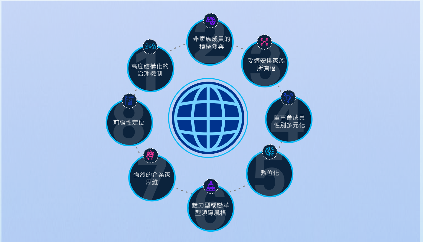
圖五、有助於家族企業展現永續績效的八項關鍵

《報告》中也指明，唯有當以上八項關鍵因素綜合起來發揮功用後，才能真正讓家族企業持續展現永續的成果。