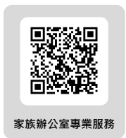
家族辦公室專業服務