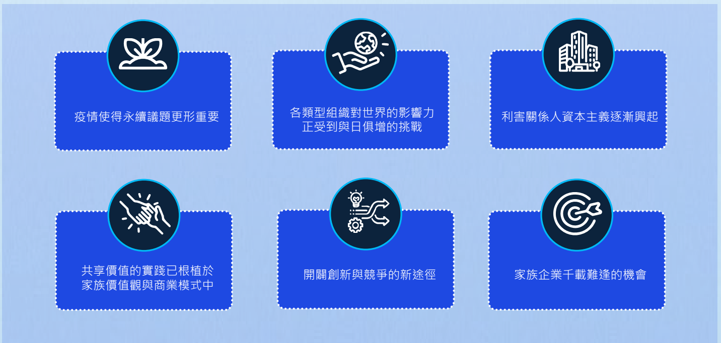
圖一、利害關係人資本主義成為主流

雖然每個家族對於永續行動實踐的過程及方法不盡相同，但是他們所取得的永續成就，對於各類型組織來說是極具啟發意義的，《報告》指出，家族企業有千載難逢的機會發揮更大的社會影響力，藉由其長期願景及跨代的思維作為永續藍圖，引領其他組織邁向永續之旅，並將利害關係人的價值納為主流。