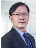
Nge Huy 合夥人 審計服務