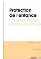
Protection de l'enfance - Nouveaux modes de prise en charge (2018)