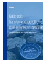
Guide de la transformation de l'offre d'accompagnement - Secteur du handicap (2020)