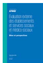
Evaluation externe des ESSMS (2015)