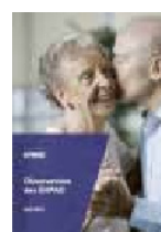
Observatoire des EHPAD (2014)