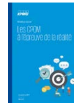
Les CPOM à l'épreuve de la réalité (2017)