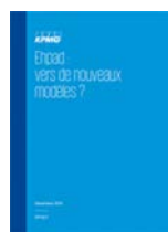
Ehpad : vers de nouveaux modèles (2015)